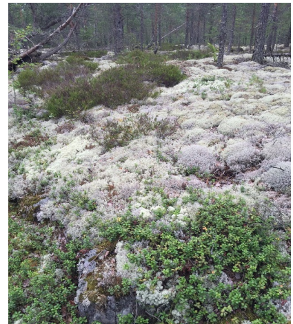
Kuva 1. Alueen kalliot ovat pääosin jäkälän peittämiä

Avokallioina on kuvattu myös harmaa jäkälä, jonka alla on kova nopeakulkuinen kallio. Katso esimerkkikuva.